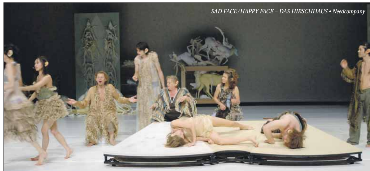
SAD FACE/HAPPY FACE – DAS HIRSCHHAUS • Needcompany