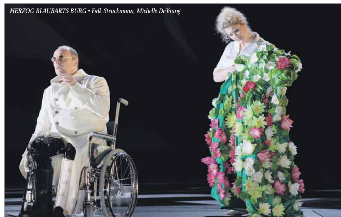
HERZOG BLAUBARTS BURG • Falk Struckmann, Michelle DeYoung