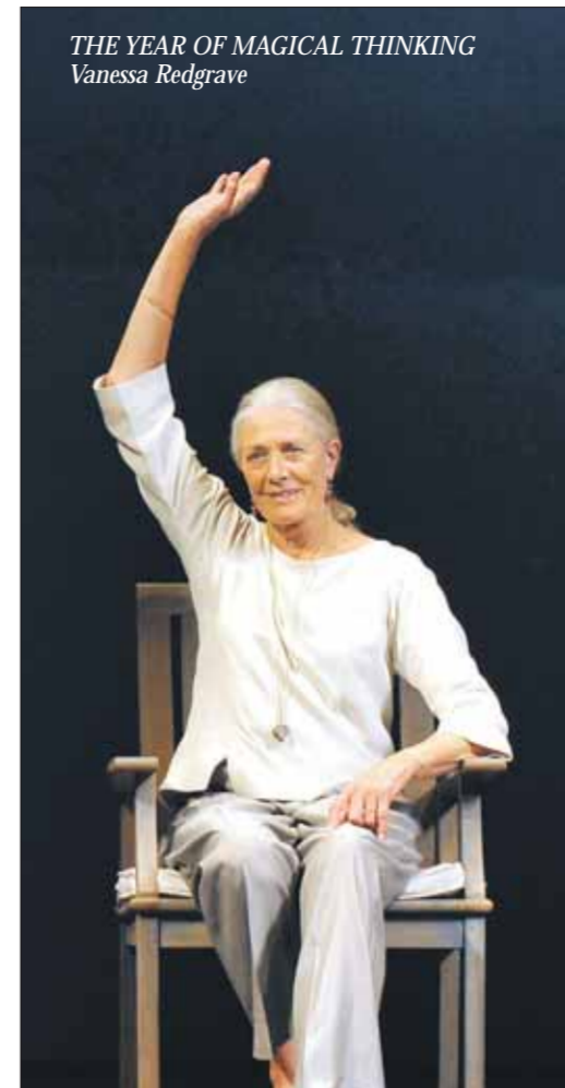
THE YEAR OF MAGICAL THINKING Vanessa Redgrave