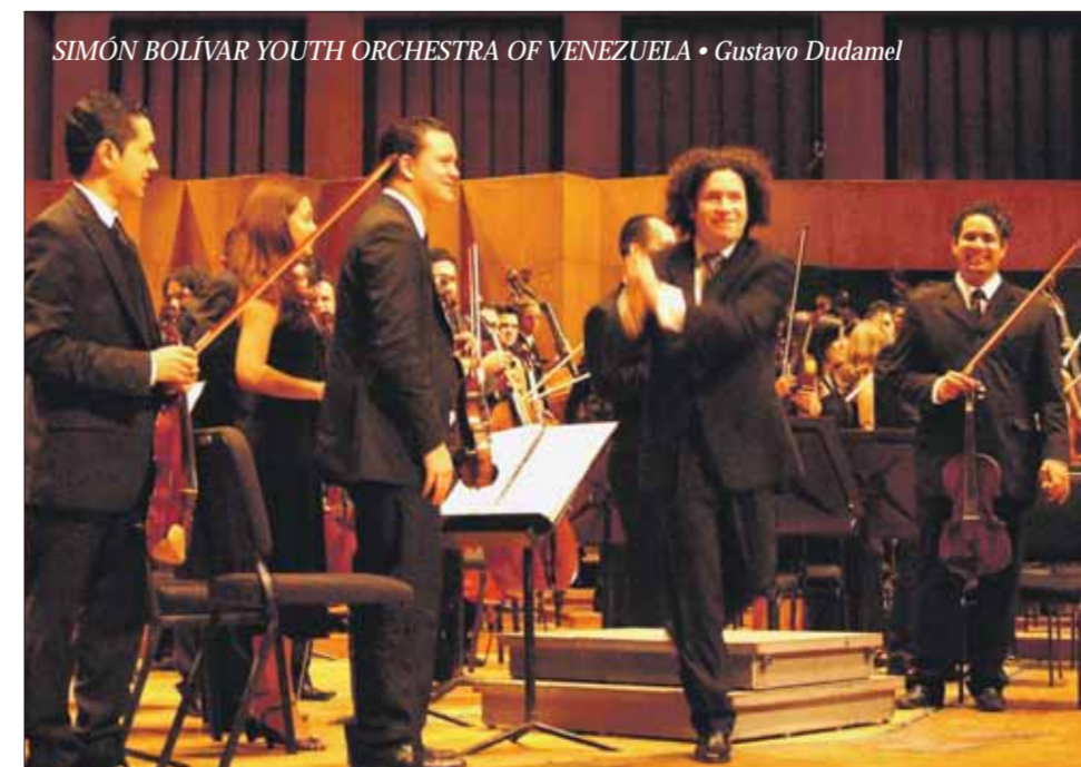
SIMÓN BOLÍVAR YOUTH ORCHESTRA OF VENEZUELA • Gustavo Dudamel